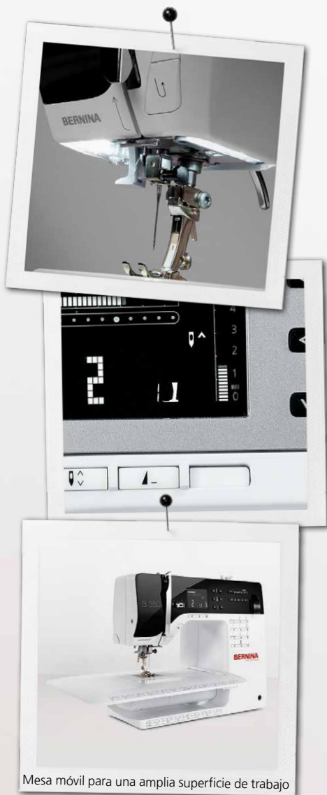
Mesa móvil para una amplia superficie de trabajo

Descarga gratuita: instrucciones de proyectos y patrones disponibles para su descarga en bernina.com/3series