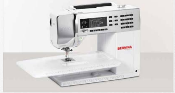
B 530 con mesa deslizante

Las BERNINA 530 y 570 QE unifican una tecnología punta tanto en la costura como en el acolchado con un elegante diseño. Nuestros ingenieros han sabido combinar a la perfección la funcionalidad fácil e intuitiva con la estética moderna creando así nuevos estándares de diseño.