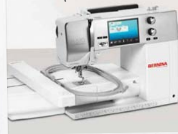
B 570 QE con módulo de bordar (opcional)

La B 570 QE es un verdadero multitalento, puede coser, acolchar y bordar. El cambio de la función de costura al bordado se efectúa cómodamente mediante la pantalla táctil. Se encuentran integrados en la propia máquina 50 diseños de bordado. Los diseños de bordado pueden ser cargados por medio de un puerto USB. Todos los diseños de bordado se pueden rotar, espejar, aumentar, disminuir o cambiar de color directamente mediante la pantalla táctil.